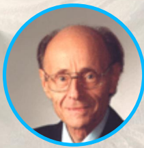
Dr. Wolfgang Ludwig (Fisico, 1927—2004)

Uno scienziato che per decenni si è occupato in modo altamente qualificato della zona di confine che separa la Medicina dalla Fisica fino a diventare un “biofisico” di fama internazionale . Egli sviluppò presso l’Università di Frisburgo in Brisgovia un simulatore capace di compensare gli improvvisi sbalzi negativi delle onde cosmiche, in modo che essi non disturbassero l’organismo umano . Impiegando segnali elettromagnetici con diverse frequenze, pervenne ad interessanti risultati.